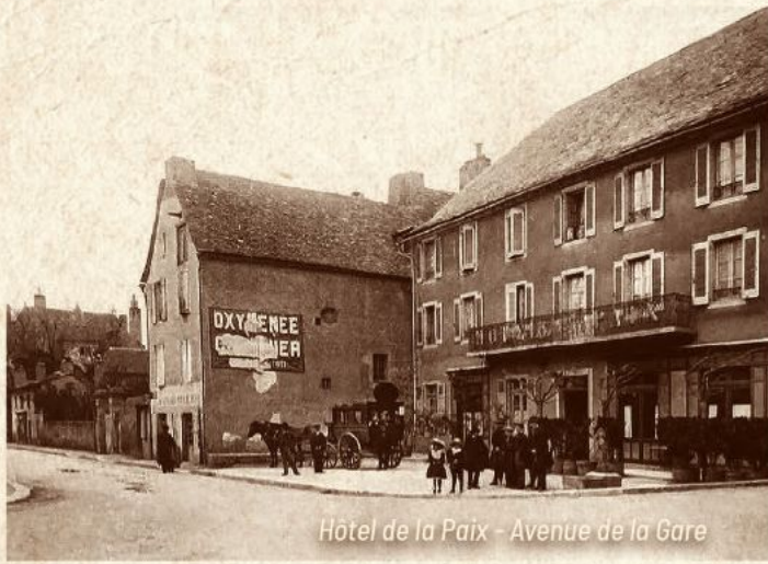
Hôtel de la Paix - Avenue de la Gare