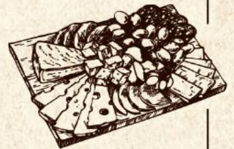
PLANCHE DE CHARCUTERIE ..... 15,00 €