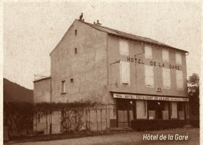
Hôtel de la Gare