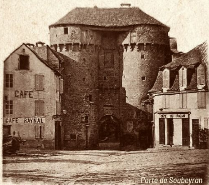
Porte de Soubeyran